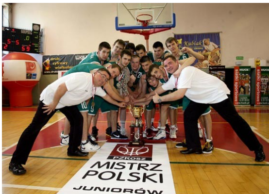
KS Korona Kraków MISTRZ POLSKI JUNIORÓW 2009 rok.